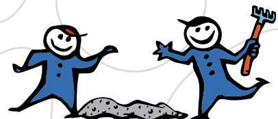
S5 - snadno zpracovatelný beton