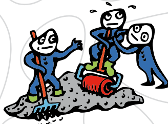
S4 - průměrně zpracovatelný beton