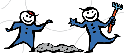
S5 - snadno zpracovatelný beton