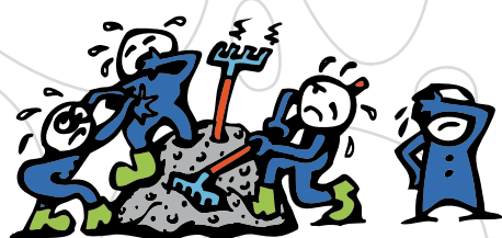
S3 - těžko zpracovatelný beton