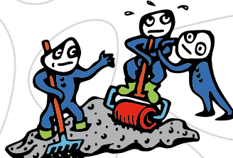
S4 - průměrně zpracovatelný beton