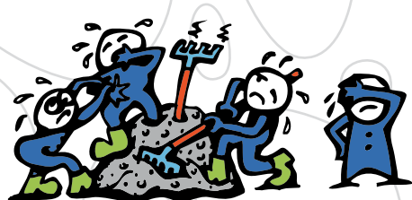
S3 - těžko zpracovatelný beton