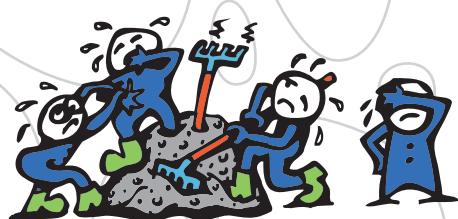
S3 - těžko zpracovatelný beton