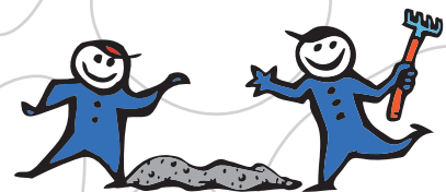
S5 - snadno zpracovatelný beton