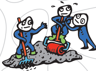
S4 - průměrně zpracovatelný beton